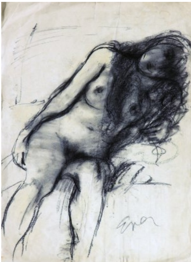
Akt – Eva | 1985, uhel, papír, 70 × 50 cm