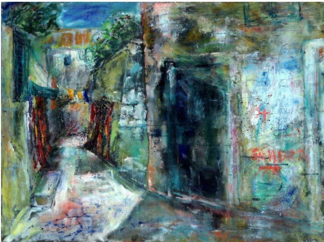
Ulička na jihu | olej, plátno, 76 × 100 cm