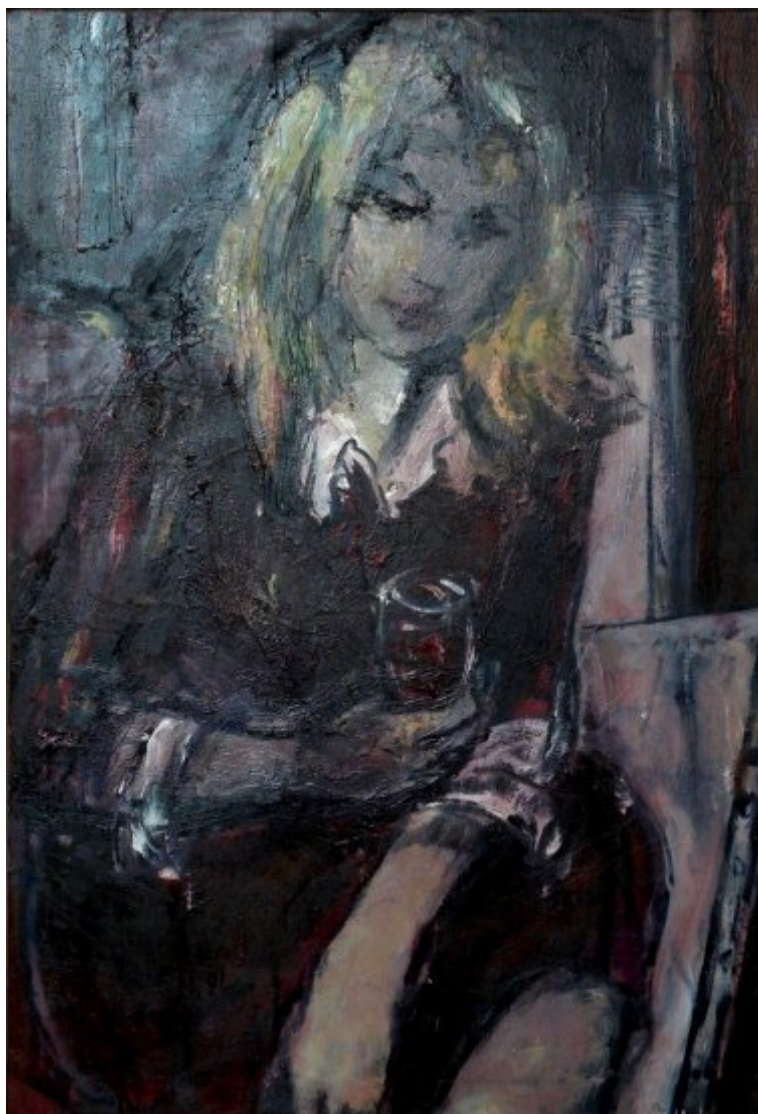
Sestra Gabriela | olej, plátno, 95 × 64