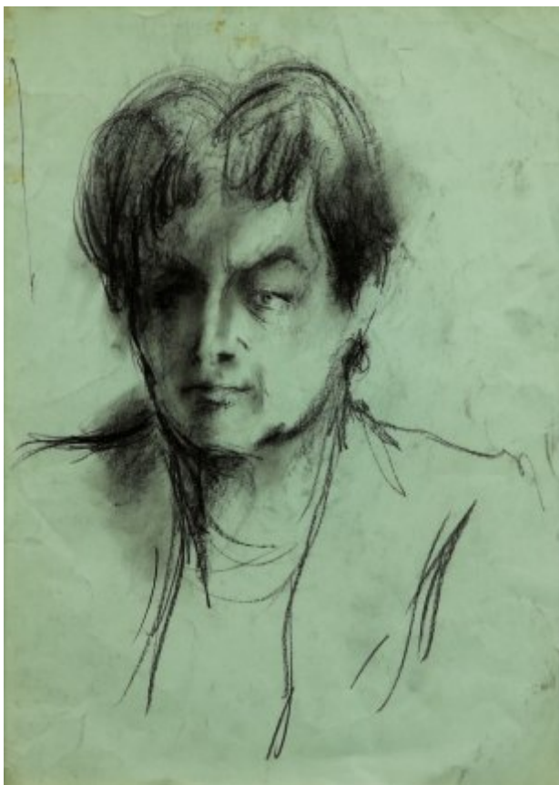
Portrét ženy | uhel, papír, 62 × 50 cm