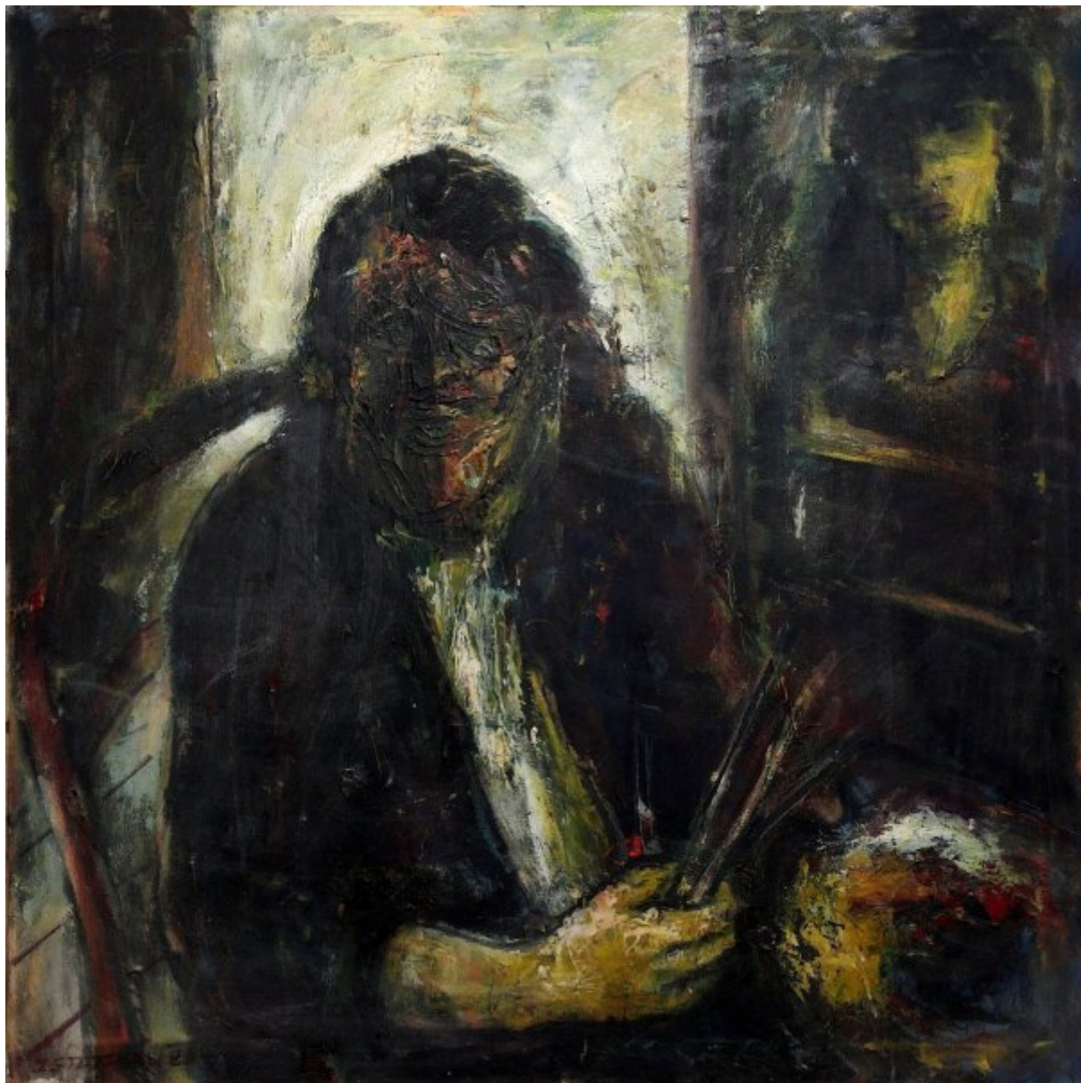
Autoportrét | 1985, olej, plátno, 100 × 100 cm