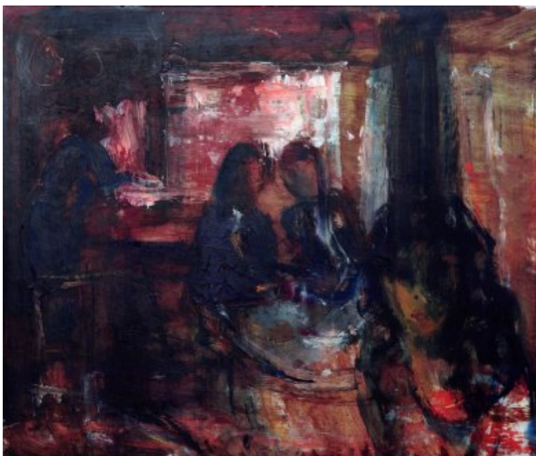
olej, sololit, 40 × 60 cm | Granada ve 2:00