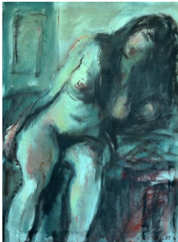
1985, olej, plátno, 85 × 65 cm | Akt – Eva