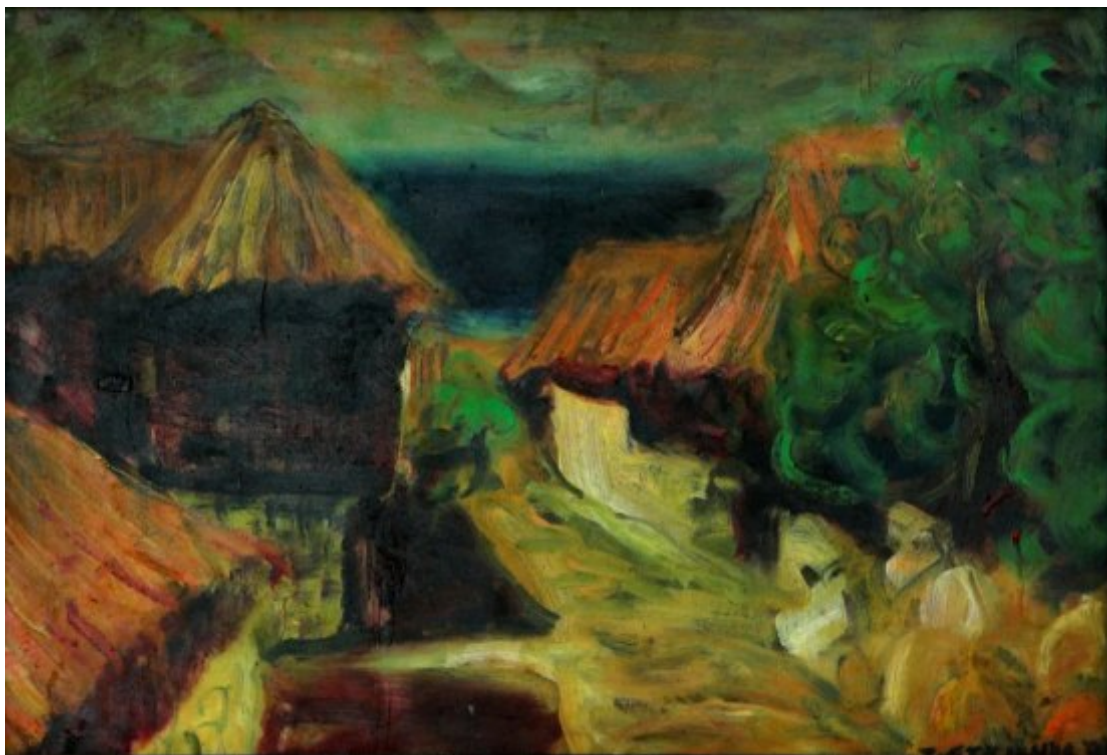
Bulharsko | 1975, olej, sololit, 40 × 60 cm