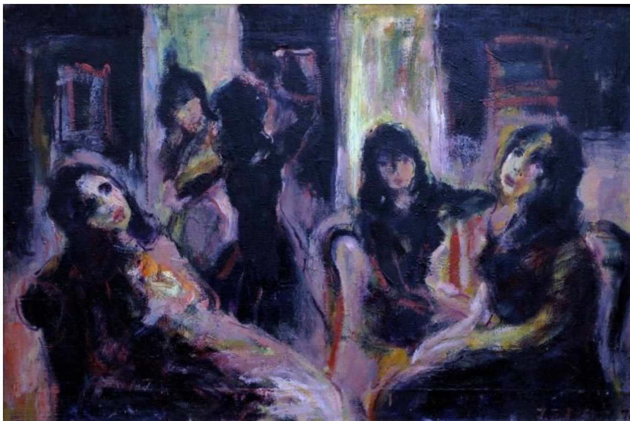
Před premiérou | 1976, olej, plátno, 80 × 120 cm