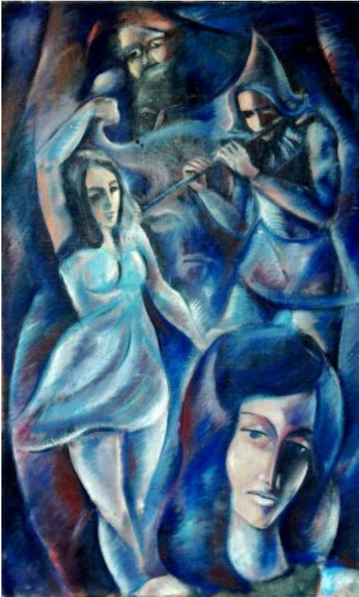
Kejklíři | olej, plátno, 96 × 72 cm