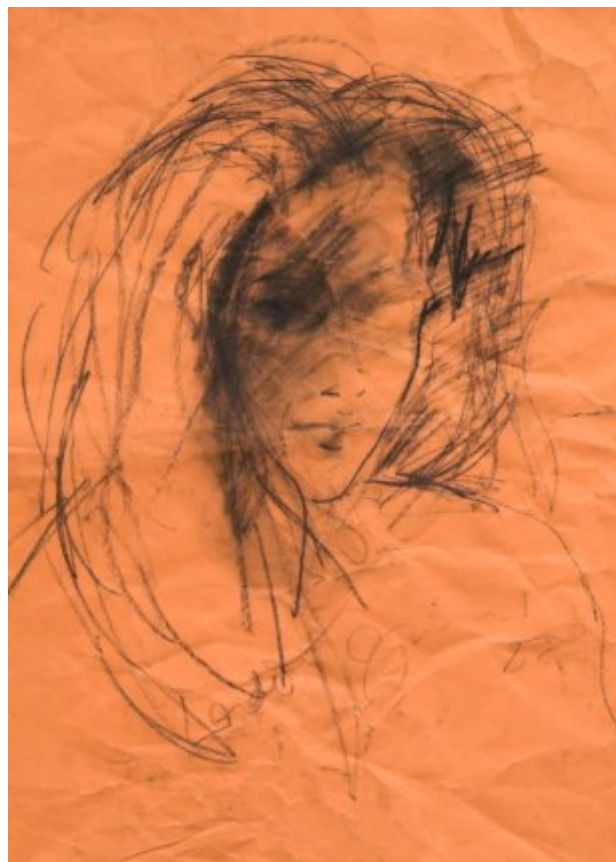
1988, uhel, papír, 62 × 50 cm | Portrét – Lada