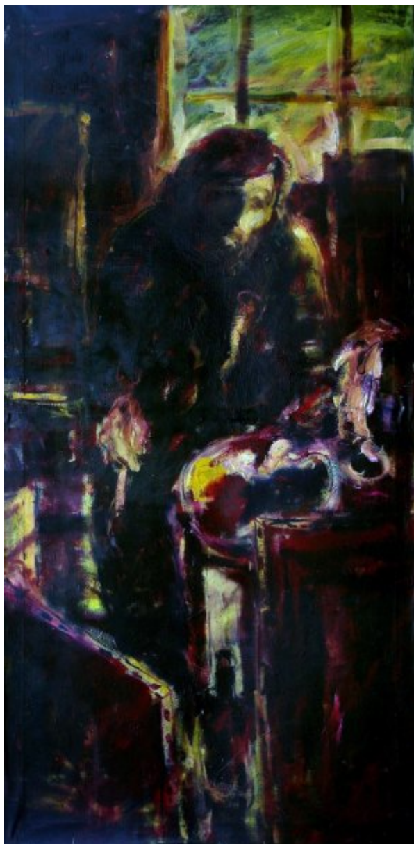
Ateliér u Fakíra | olej, plátno, 190 × 100