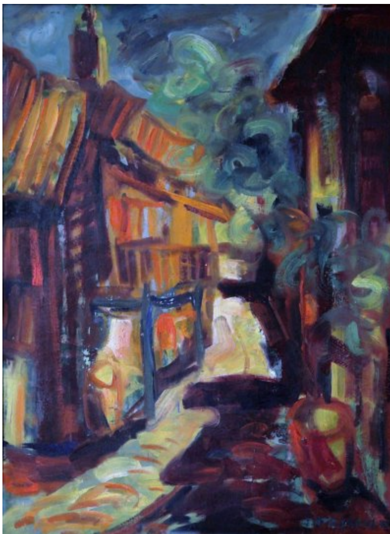
Sozopolská ulička | 1975, olej, lepenka, 68 × 50 cm