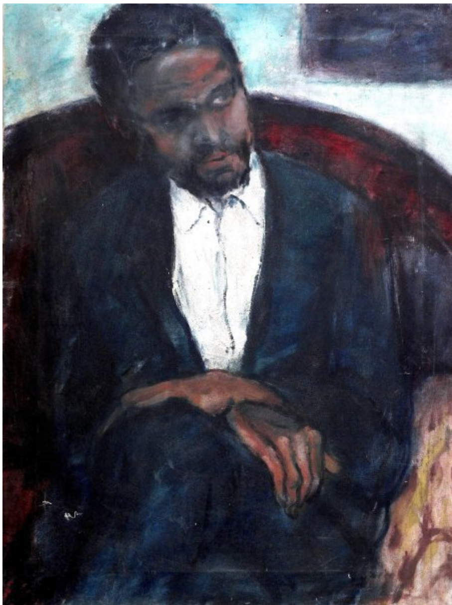
Černoch Evžen | olej, plátno, 75 × 100 cm