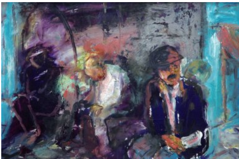
Španělská rána | olej, sololit, 38 × 56 cm