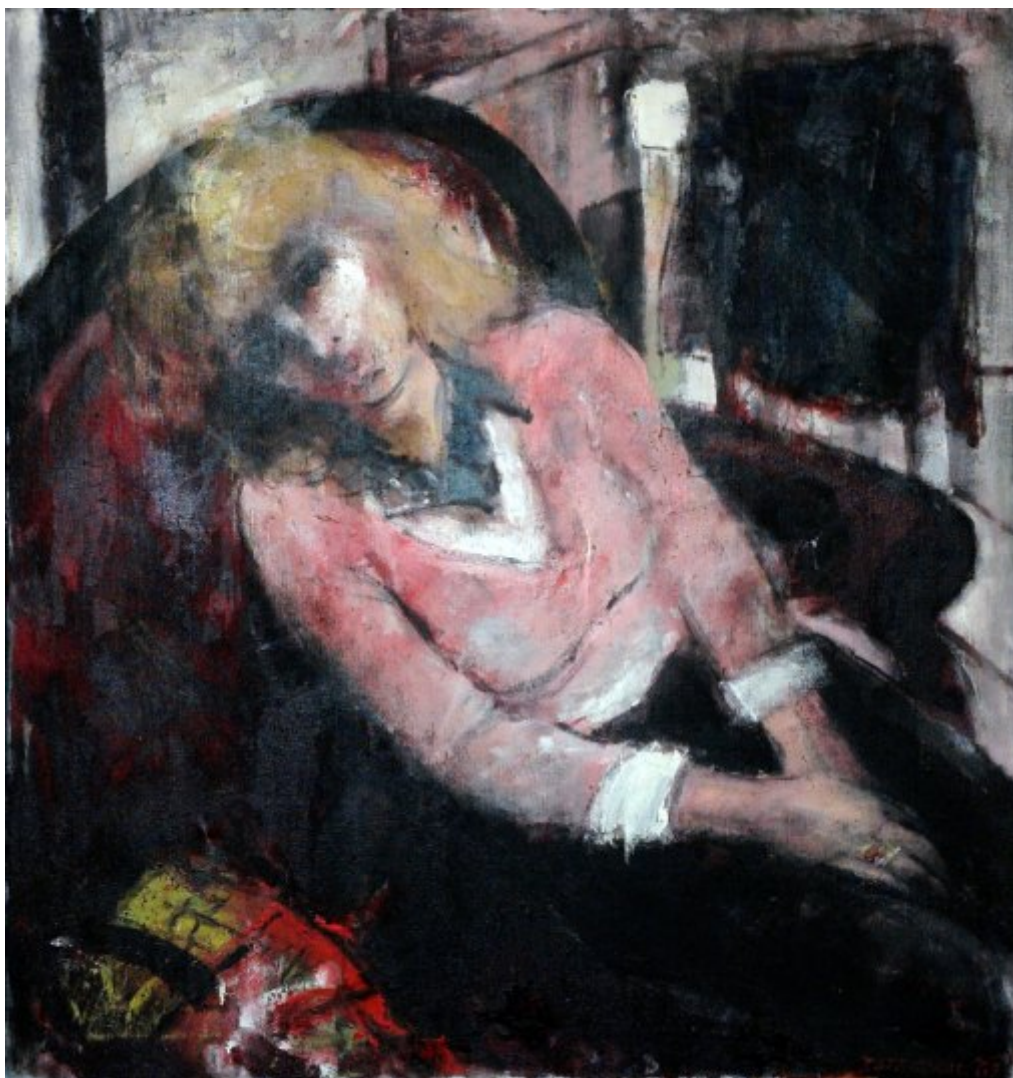
Vlad'ka | 1983, olej, plátno, 98 × 92 cm