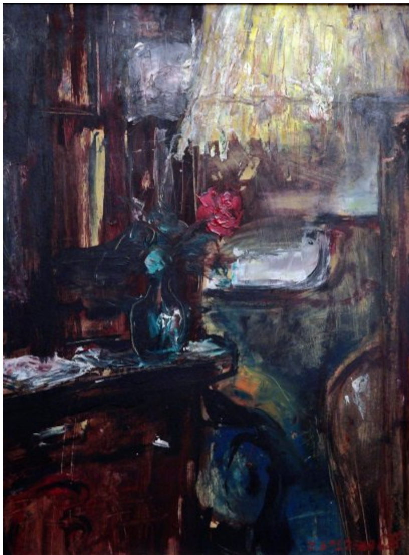
Zátiší s růží | 1988, olej, sololit, 61 × 46 cm