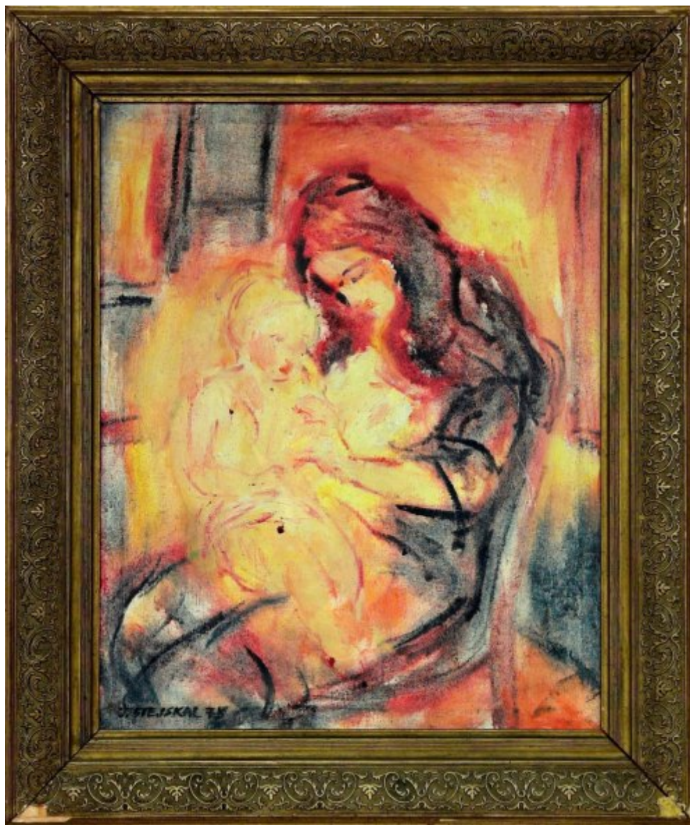
Madona | 1975, olej, plátno, 70 × 60 cm