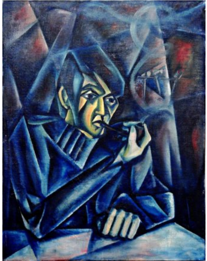
olej, plátno, 72 × 56 cm | Muž s dýmku