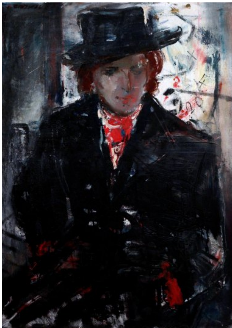
Dáma v klobouku | 1987, olej, plátno, 90 × 65 cm