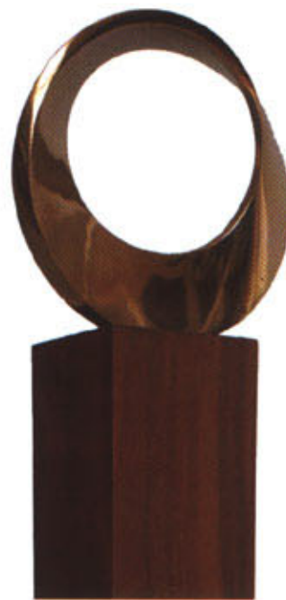
ZDENĚK KUČERA / JEDNOSTRANNÉ NEZIKRUŽÍ / BRONZ