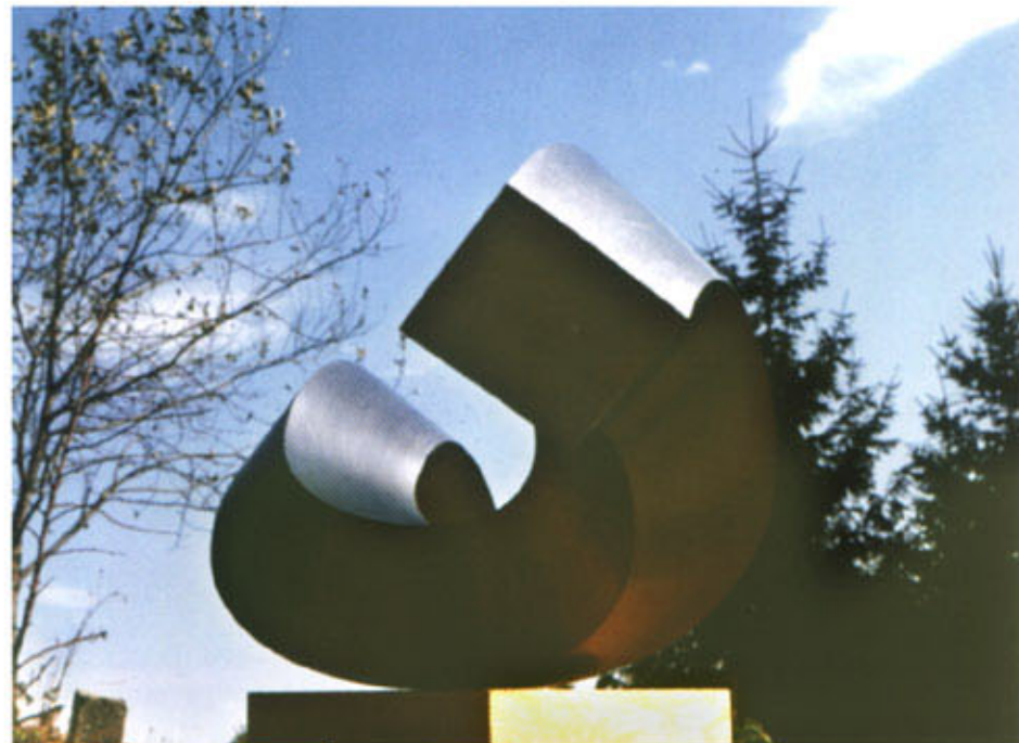
ZDENĚK KUČERA / ŠIKANA 1 / NEREZ