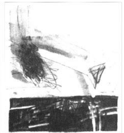
JILJÍ SEDLÁČEK / KRESBA