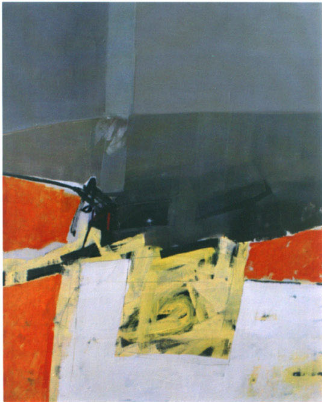
JILJÍ SEDLÁČEK / BEZ NÁZVU / OLEJ