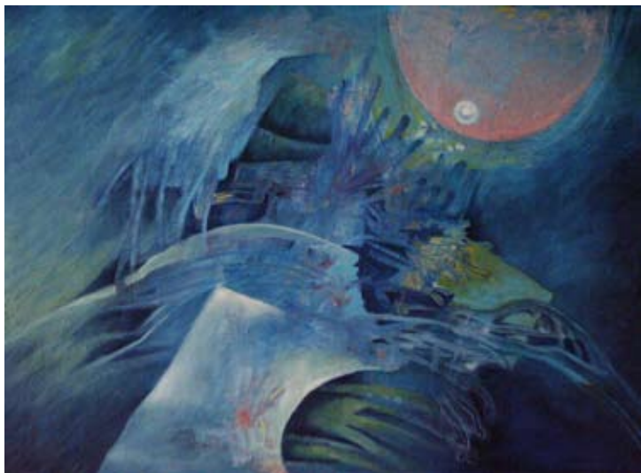
■■■ STŘEDOMOŘÍ / 120 x 80 cm / olej na plátně