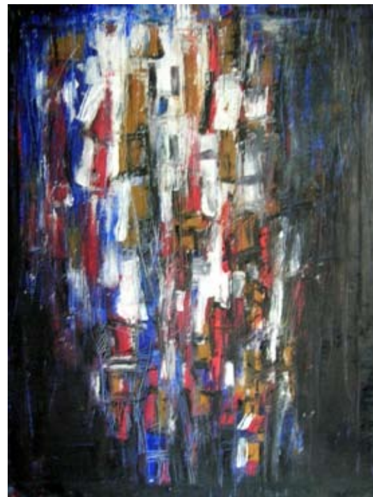
PO / 95 x 70 cm / olej na plátně ■■■

Základní literatura: Sedum ku pěti. Výstava mladých členů a přátel UVUO (obrazy, fotografie, volná tvorba). [Katalog výstavy]. Neznačený text, medailony autorů. [Olomouc, Unie výtvarných umělců Olomoucka 2006]. – Česko-dánský workshop / Czech-danish workshop. Šternberk 2006. [Katalog k výstavám]. Text Štěpánka Bielezová, medailony autorů. Šternberk, Městská kulturní zařízení - Galerie Šternberk 2006. – Q/arto. Unie výtvarných umělců Olomoucka 2003-2006, Olomouc, Unie výtvarných umělců Olomoucka 2007, s. 39.