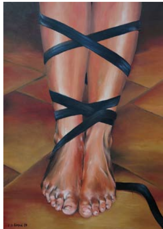
CONIUNCTUS / 100 x 70 cm / olej na plátně ■■■

Základní literatura / Primary sources: Sedum ku pěti. Výstava mladých členů a přátel UVUO (obrazy, fotografie, volná tvorba). [Katalog výstavy]. Neznačený text, medailony autorů. [Olomouc, Unie výtvarných umělců Olomoucka 2006]. – Q/arto. Unie výtvarných umělců Olomoucka 2003-2006, Olomouc, Unie výtvarných umělců Olomoucka 2007, s. 96.