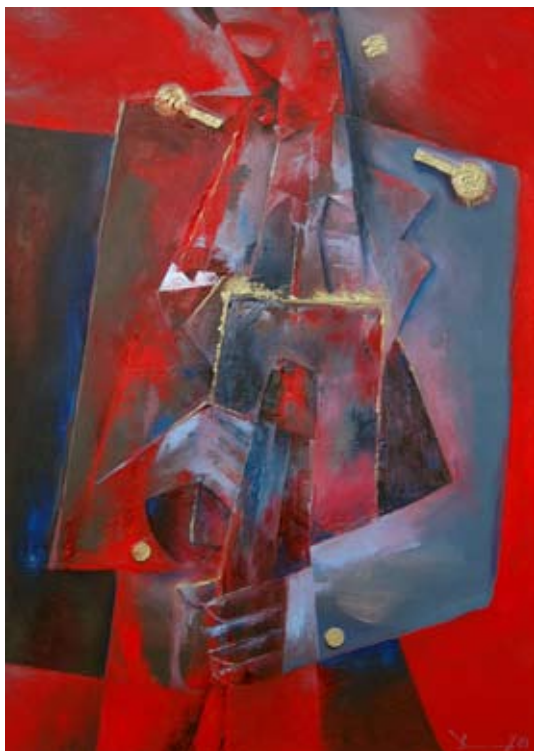
■■■ IDOL / 100 x 70 cm / olej na plátně